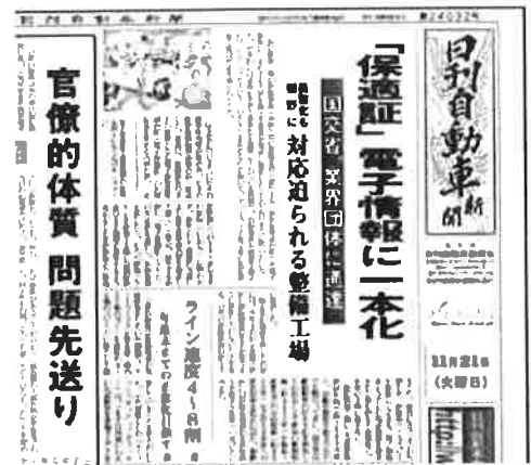
(日刊自動車新聞 2017年11月21日1面)

と題した記事が掲載されました。今後、指定整備工場様では電子保適証の対応が必須になりそうな状況です。 電子保適証の整備システムの対応についてご質問やご相談がございましたら、担当営業か弊社サポートセンターまでどうぞお問合せください。(フリーダイヤル 0120-026-255)